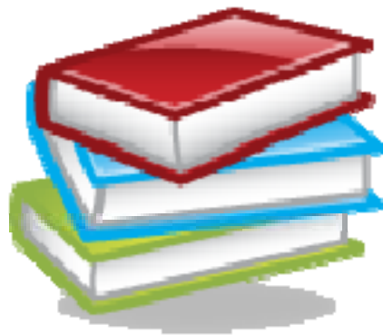
圖 書 編