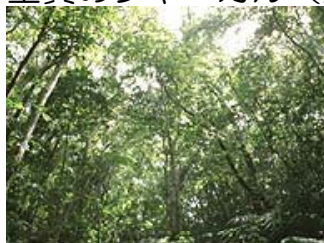
北部の山のイタジイ林

土の色や性質も違います。北部地域は、粘板岩が変化してできた土で、国頭マーシと呼ばれ、赤っぽい土、中南部地域は、石灰岩が変化してできた島尻マーシ（こげ茶っぽい土）と、ねん土質のジャーガル（灰色っぽい土）からできています。