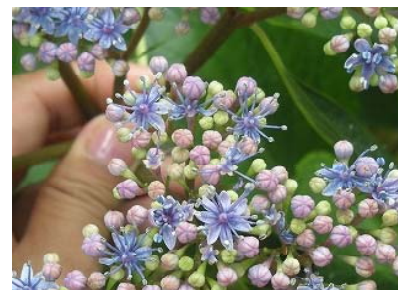
ガクアジサイの両生花