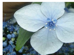
ガクアジサイの装飾花